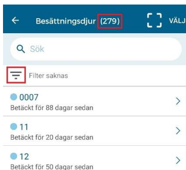
Bild 1. Besättningsdjur

Klicka på menyvalet "Besättningsdjur" på startskärmen. Här finns alla dina suggor och ingångsrapporterade gyltor listade. På bild 1 nedan kan du se att det totala antalet djur är 279 st. För att skapa ett filter, klicka på symbolen till vänster om "Filter saknas".