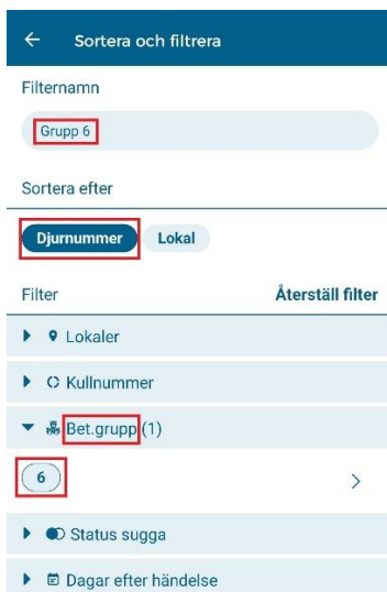
Bild 2. Skapa ett filter

Fyll i ett egenvalt filternamn längst upp. Välj sedan om du vill sortera djuren efter djurnummer eller efter lokalnamn. Slutligen väljer du om du vill skapa ett filter utefter lokal, kullnummer, bet. grupp, status på suggan (t. ex. tom eller dräktig) eller dagar efter en viss händelse. I exemplet på bild 2 har vi valt filternamnet "Grupp 6", att sortera djuren efter djurnummer och att filtrera på djur som har den gemensamma nämnaren betäckningsgrupp 6.