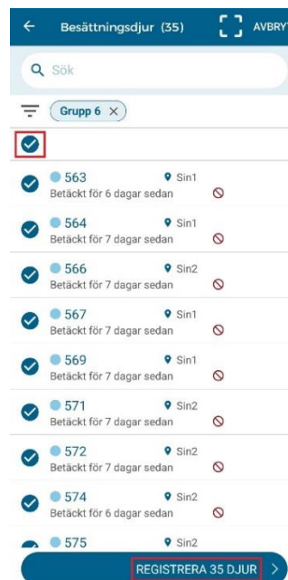
Bild 4. Registrera händelse

Bocka för cirkeln längst upp för att välja alla djur, se bild 4. Om några djur ska uteslutas bockar du ur cirkeln framför dessa djur. Tryck sedan "Registrera 35 djur". Välj önskad registrering, t. ex. flytt eller behandling, tryck på spara.