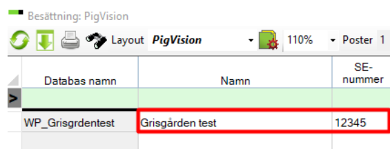
Bild 1. Besättningsnamn och SE-nummer